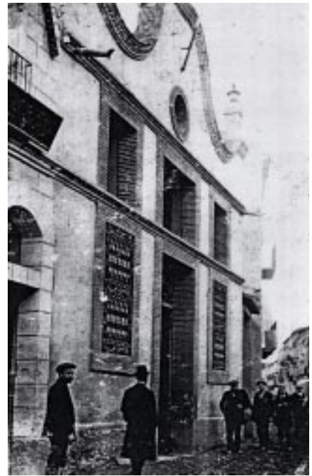
Edifici de la Dàlia Blanca. Any 1910