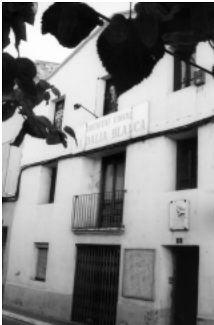
Imatge actual de la Dàlia Blanca

especialment en cançons patriòtiques del famós compositor català Josep Anselm Clavé.