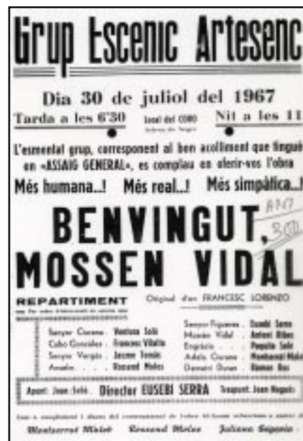
Cartell publicitari de l'obra Benvingut, Mossèn Vidal representada l'any 1967