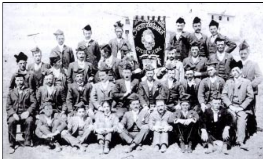
Societat Coral la Dàlia Blanca. Principis de segle XX