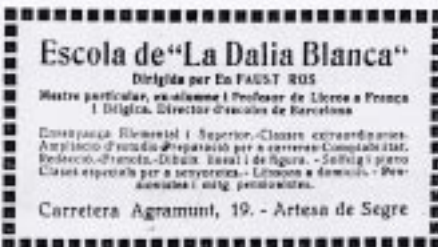
Anunci extret del diari artesenc Renaixement . 10 de novembre de 1922