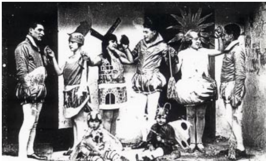
Representació teatral de principis de segle XX a la Dàlia Blanca