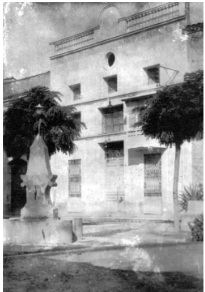
La Dàlia Blanca a mitjans del segle XX