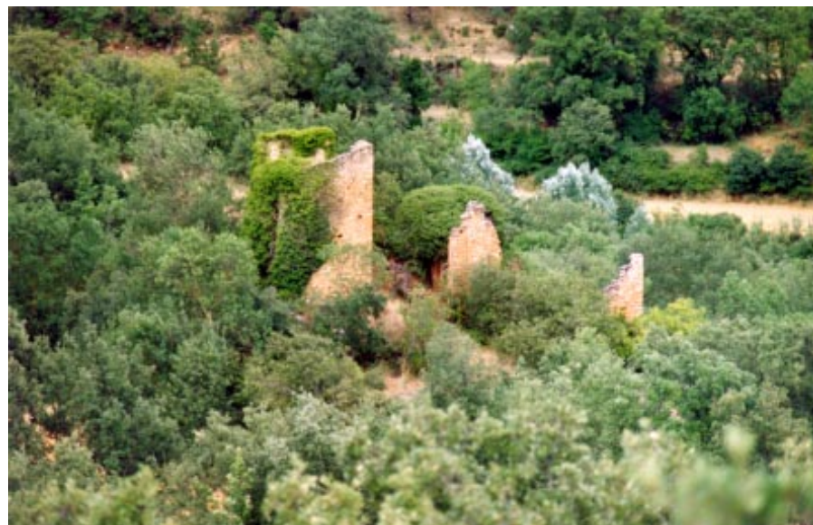
Castell d'Ariet, del qual depenia l'església de Sant Bartomeu a l'edat mitjana