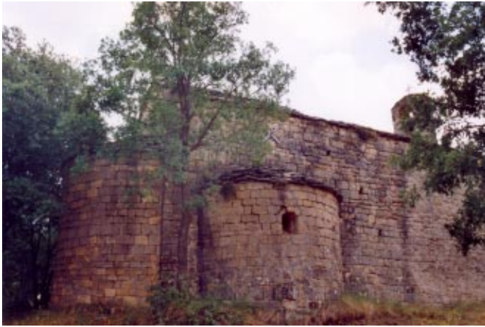
Església de Sant Bartomeu amb el cementiri adossat

façana hi veiem una de les 4 finestres del temple, aquesta en forma de creu on el braç vertical és més llarg i estret. Les altres tres obertures estan realitzades amb arc dovellat i les trobem a cada un dels absis.