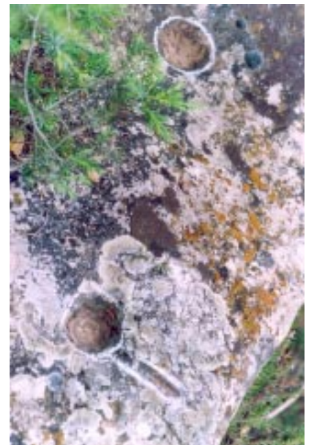
Figura 2 s'han