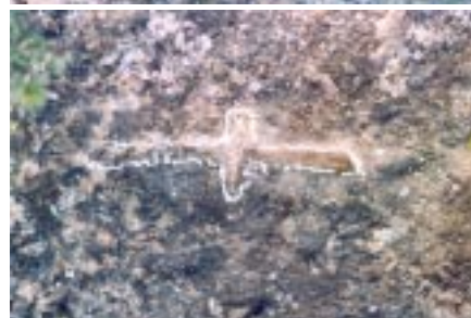
Figures 6, 7 i 8