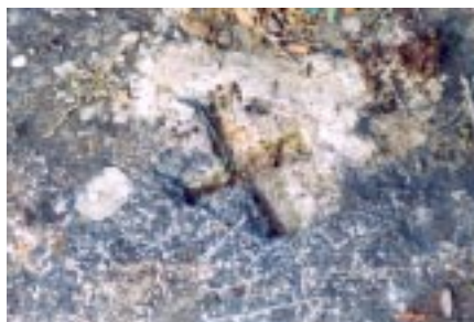
Figures 3, 4 i 5

enllà abans de fer un pronunciament definitiu sobre la datació d'aquestes inscultures, i en això estem treballant.